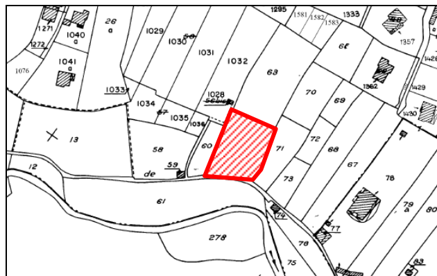
Plan de cadastre